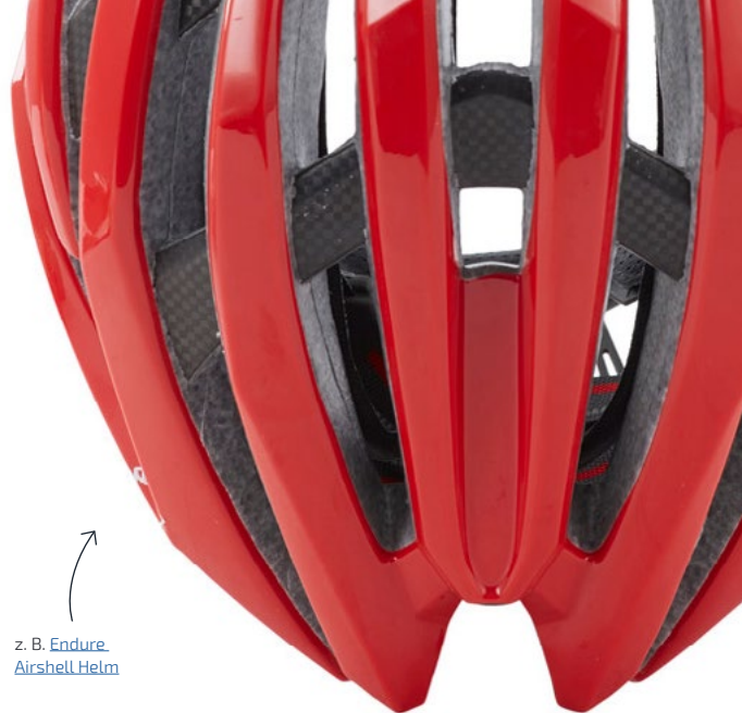
z. B. Endure Airshell Helm

Auch die Augen wollen vor Sonnenlicht, Insekten und Schmutz geschützt sein. Eine selbsttönende Brille bzw. eine Brille mit Wechselgläsern und integriertem UV-Schutz helfen effektiv. Velobrillen gibt es in ganz unterschiedlichen Preisklassen. Für den Weg zur Arbeit, muss es aber sicher nicht die High End Sportbrille sein. Auf fahrrad.de findest du Velobrillen für jeden Geldbeutel.