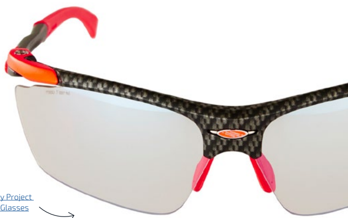
z. B. Rudy Project Proflo Glasses