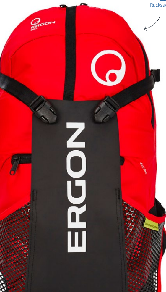
z. B. Ergon BX3 Rucksack