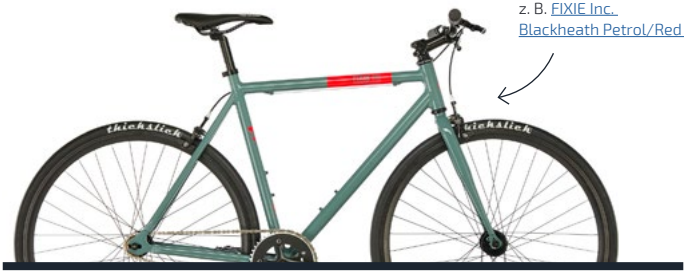
z. B. FIXIE Inc. Blackheath Petrol/Red