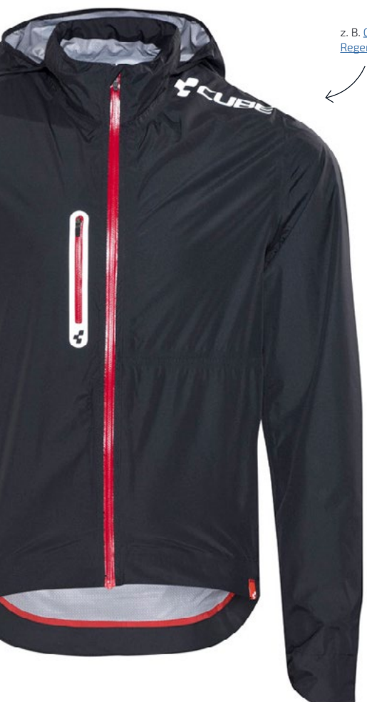
z. B. Cube Blackline Regenjacke