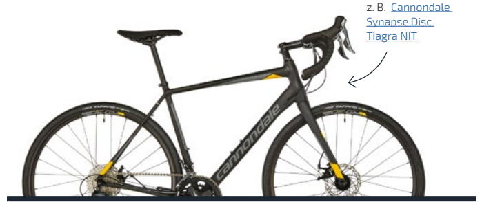
z. B. Cannondale Synapse Disc Tiagra NIT