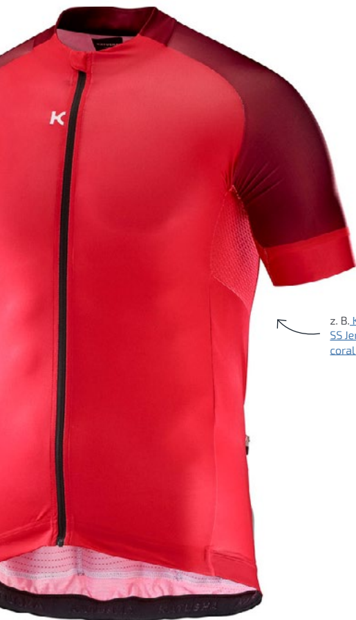
z. B. KATUSHA Icon SS Jersey Men coral sangre